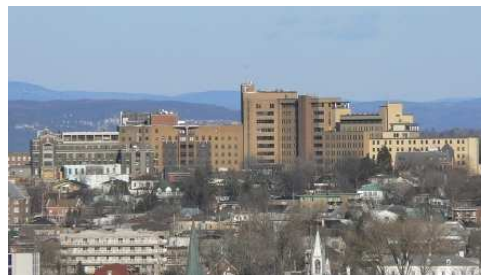
Centre de santé et de services sociaux de Chicoutimi